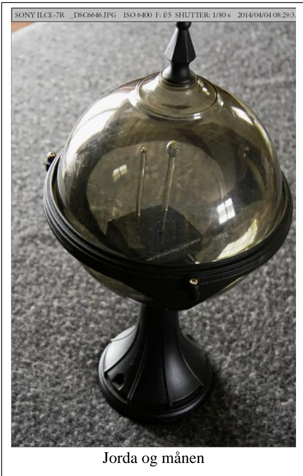
Jorda og månen

Det er laget en «Planetsti» på det som skal bli gang- og sykkelveien mellom Stokmarknes og det gamle kirkestedet på Hadsel. Vandringsstien kan brukes til å illustrere vanskelig fattbare avstander i solsystemet vårt. I «Solsystemets ytterkant» på Stokmarknes er planeten Pluto plassert som et 2 mm stort knappenålshode og etter hvert som man nærmer seg «Solsystemets senter» på Hadsel møter man planetene etter tur - Jupiter som den største vil være 15 cm - for til slutt å se sola med en diameter på 1.3 m. Vandringsstien vil også gi en opplevelse av plasseringen av planetene - Jorda vil være 150 m fra Hadsel mens den nærmeste planeten Merkur vil befinne seg 60 m fra «Sola». Etter at man har gått planetstien og lest den korte informasjonen som står på hver søyle, vil man på Kulturminneparkens hjemmesider